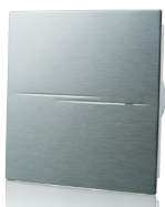
Квайт-Стайл А (с декоративной накладкой из алюминия)